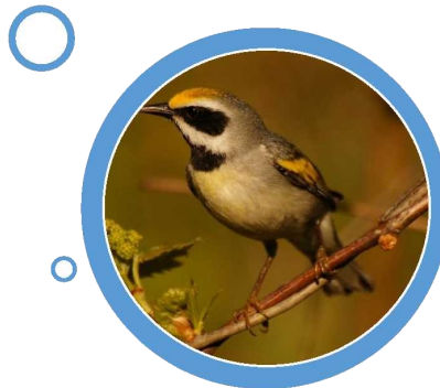
Paruline à ailes dorées