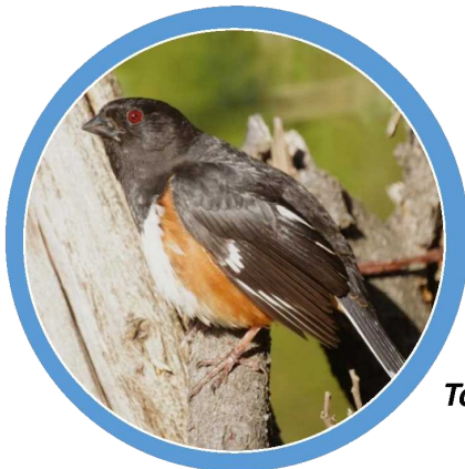
Tohi à flancs roux