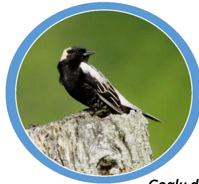
Goglu des prés