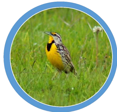
Sturnelle des prés