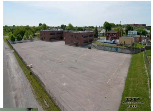
Vue avant les travaux

◆ Claire Lachance, directrice Comité ZIP Haut Saint-Laurent auxquels se sont ajoutées plusieurs personnes