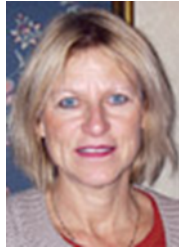
par Claudine Desforges