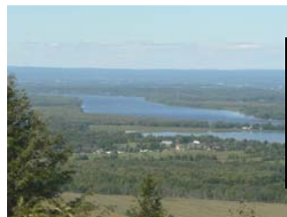
Rivière des Outaouais (Rigaud)

Tenez-vous au courant et soyez des nôtres pour l'inauguration officielle en 2012!