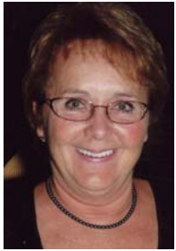
Par Marthe C. Théorêt