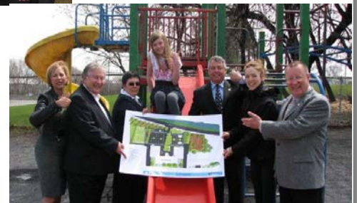
La nouvelle cour d'école