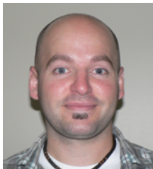
Par Patrick Laniel Chargé de projet