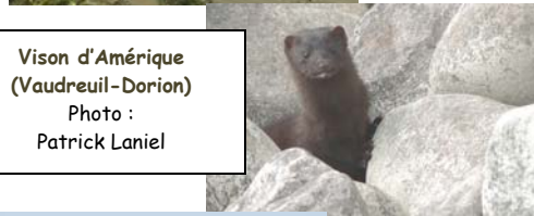
Vison d'Amérique (Vaudreuil-Dorion)