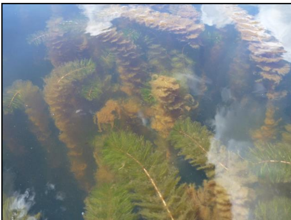
Myriophylle à épis