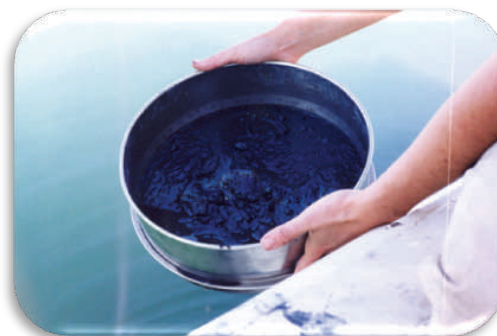
Sédiments Rivière Saint-Louis, caractérisation