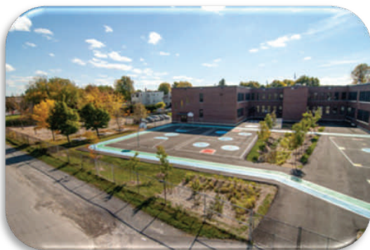
Parc-école, École Sacré-Cœur, quartier Champlain