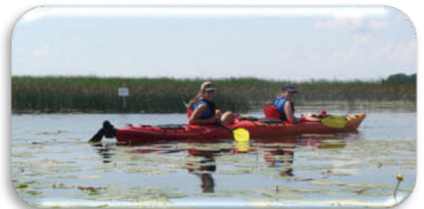
La Route bleue du Haut-Saint-Laurent