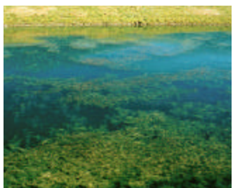
Myriophylle à épis