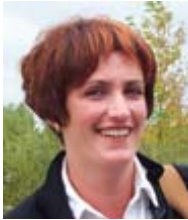
par Danielle Glaude

Une nouvelle ordonnance d'approbation (document rédigé par la Commission Mixte Internationale (CMI) pour autoriser la construction et l'exploitation d'un projet) est proposée pour la régularisation des débits et des niveaux d'eau dans le lac Ontario et le fleuve Saint-Laurent au barrage Moses-Saunders situé à Cornwall (Ontario) et à Massena (New York).