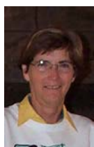
par Francine Poupard

Le café Agora existe depuis quelques années à Salaberry-de-Valleyfield. Il organise une rencontre mensuelle le dimanche matin. On y discute de divers sujets avec un invité.