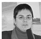
par Claire Lachance

Lors de notre dernière parution, nous vous présentions le projet d'amélioration d'une frayère en eaux vives du canal de Beauharnois.